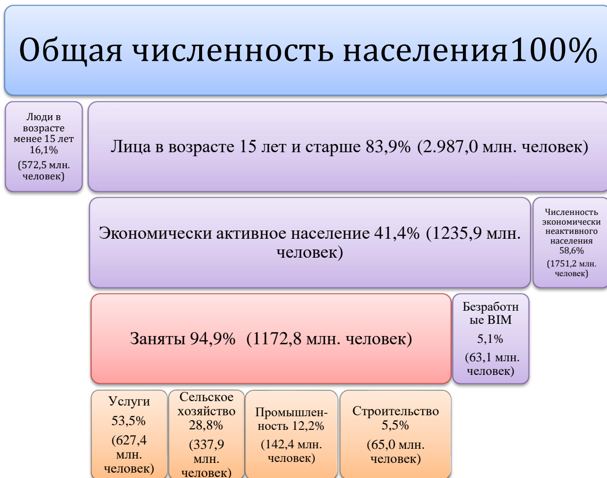
Рис. 3.2. Распределение населения по взаимосвязи с рынком труда